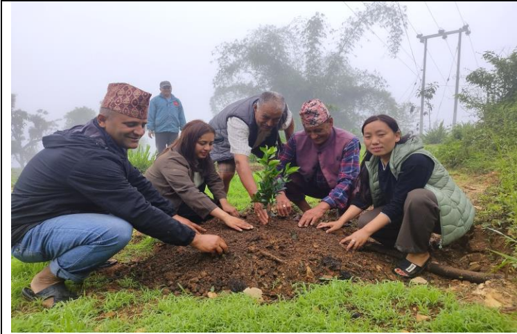
चक्लाबन्दीमा सुन्तला बिरुवा रोपण: मदाने ६, पुर्कोट