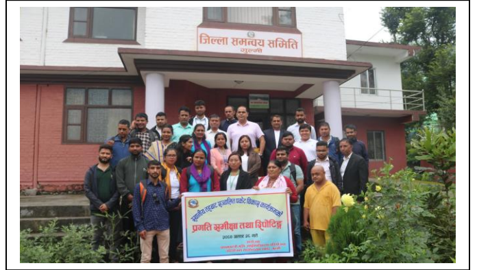
स्थानिय तहद्वारा सन्चालित पकेट विकास कार्यक्रमको प्रगति समिक्षा गोष्ठी