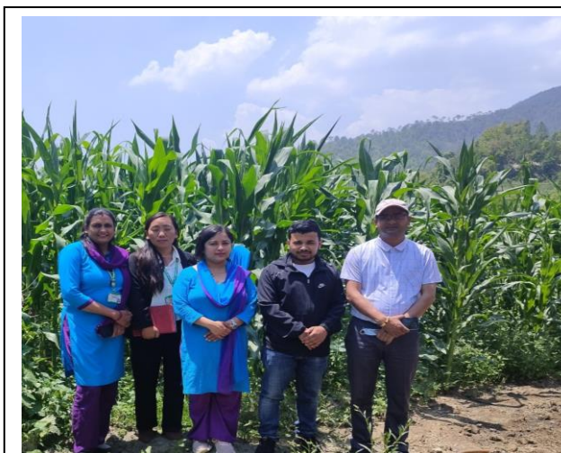
मकै बीउ उत्पादन क्षेत्र अनुगमन: इशमा ६ चौरासी