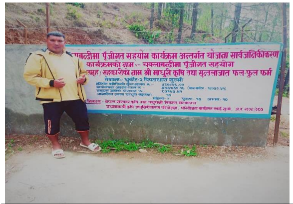
चक्लाबन्दीमा पुजिगत सहयोग कार्यक्रम अन्तर्गत सचाई पोखरी निर्माण, धुर्कोट-२, पिपलधारा