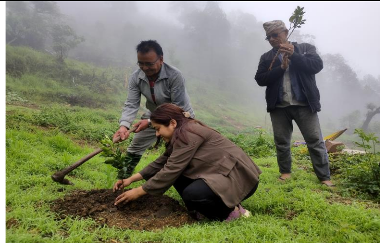
चक्लाबन्दीमा बिरुवा रोपण, मदाने ६