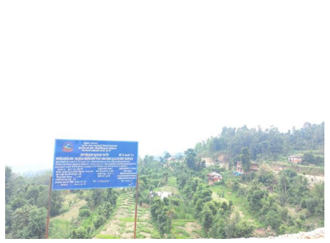
श्री कंकेदेउराली कृषक समुह, मदाने-६, पुर्कोटदह, चक्लाबन्दीमा सुन्तला खेती