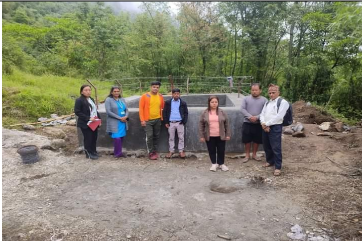
सुन्तलाजात फलफूलको चक्लाबन्दी कार्यक्रममा साना सिंचाइ, सत्यवती ४, लिम्घा