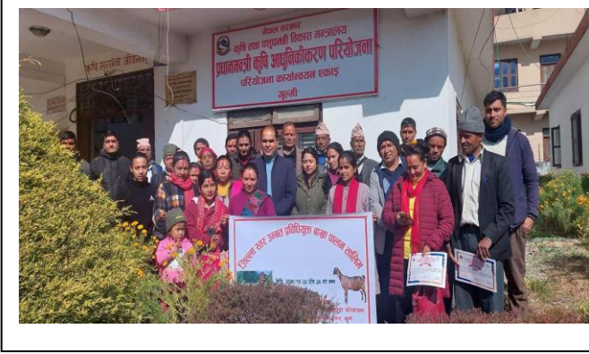
जिल्ला स्तरिय उन्नत प्रविधि युक्त बाख्रा पालन तालिम