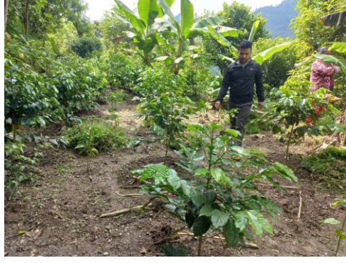
कलस्टरमा कफी क्षेत्रफल विस्तार कार्यक्रम तथा कफी विरुवा अस्थायी छाहारी व्यवस्थापन