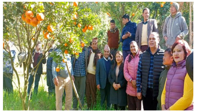
जिल्ला समन्वय समितिका प्रमुख, प्रमुख जिल्ला अधिकारी लगाएत सरोकारवाला निकायहरु संगको सयुक्त अनुगन तथा अन्तरक्रिया