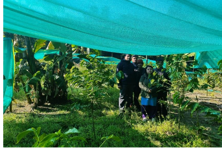
कफी क्षेत्र विस्तार कार्यक्रम मदाने ३ सिर्सेनी