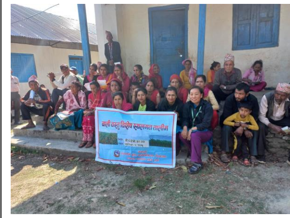
उन्नत मकै खेती प्रविधि सम्बन्धी स्थलगत तालिम