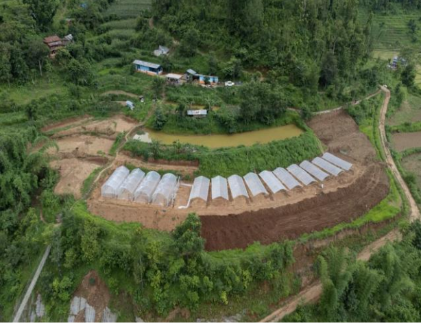
श्री रेसुङ्गा एग्रो विजनेस कन्सर्न, रेसुङ्गा-३, गुठ, यन्त्रमैत्री गहा सुधार (चक्लाबन्दीमा तरकारी खेती)