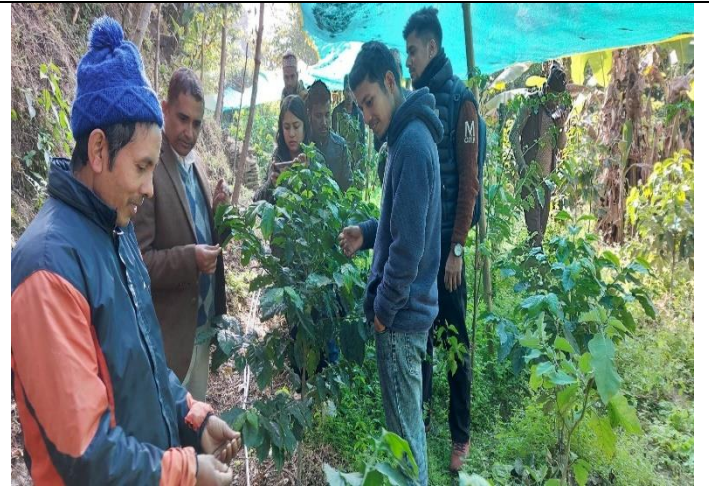
कफी कृषक पाठशालामा सहजिकरण गर्दै: मालिका ८, मरभुङ