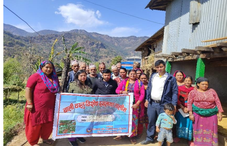
बाली बस्तु विशेष स्थलगत तालीम मालिका ७ घमिर