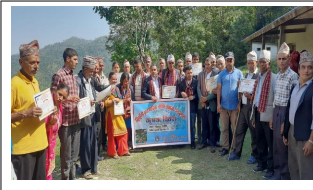
कफी कृषक पाठशाला, कृषक दिवस मदाने ३ सिर्सेनी