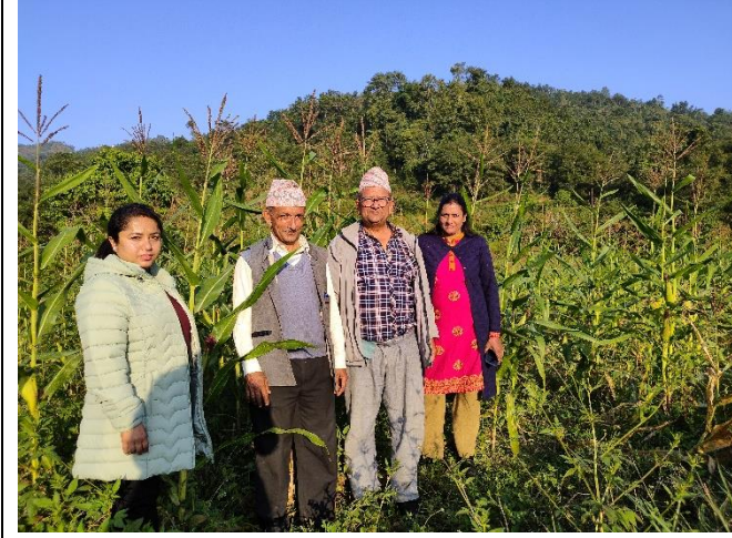
रामपुर हाईब्रिड १० लगाईएको क्षेत्रको स्थलगत अनुगमन: छत्रकोट ४