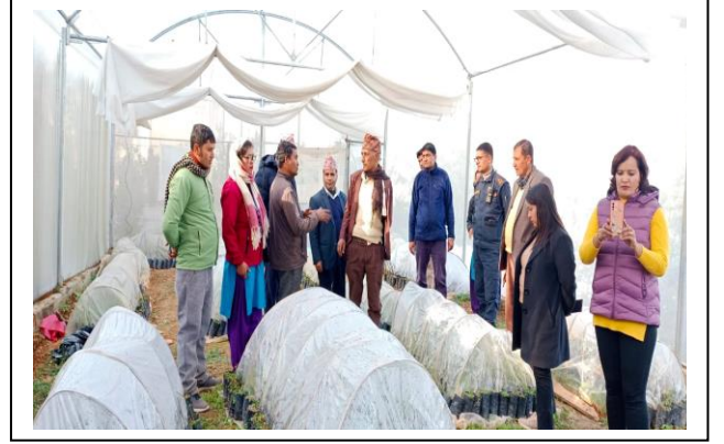
सुन्तलाजात फलफूल नर्सरी स्रोत केन्द्र, (धुर्कोट-१, नयागाँउ)