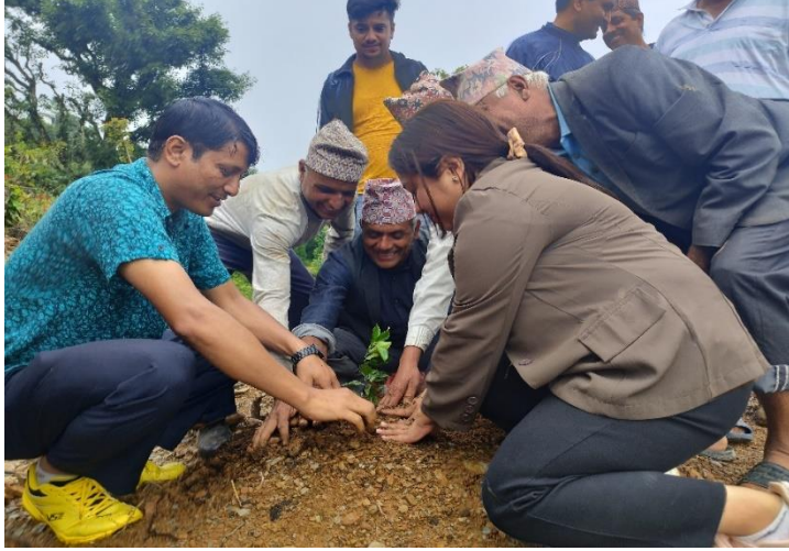
सुन्तला चक्लाबन्दी कार्यक्रममा बिरुवा रोपण: धुर्कोट २, पिपलधारा