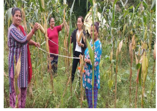
मकै बाली ऋप कटिड