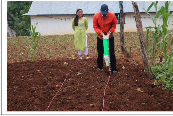
मेसिन द्वारा मकै रोपन सिकाउदै प्राविधिक