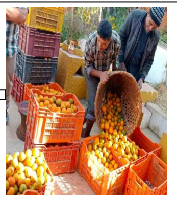
सुन्तला जोन क्षेत्रमा उत्पादित सुन्तला बजार पठाइँदै, धुर्कोट-२