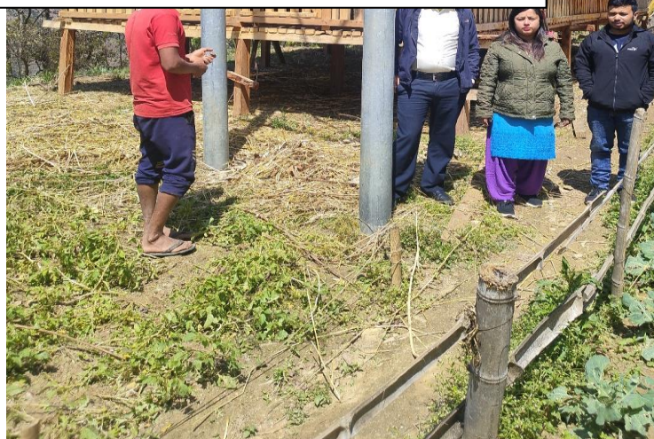
रामपुरहाईब्रिड-१० जातको बीउ उत्पादन, बासंखर्क कृषि स.स.लि.,रेसुङ्गा-१०