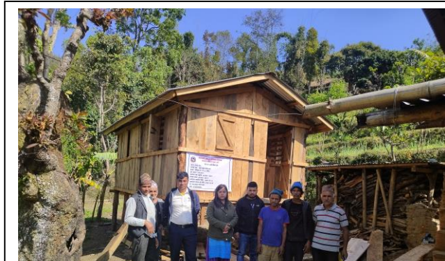
ब्यवसायिक बाखा पालक कृषकहरुका लागि उन्नत प्रवधि युक्त बाखा खोर निर्माणमा अनुदान सहयोग कार्यक्रम